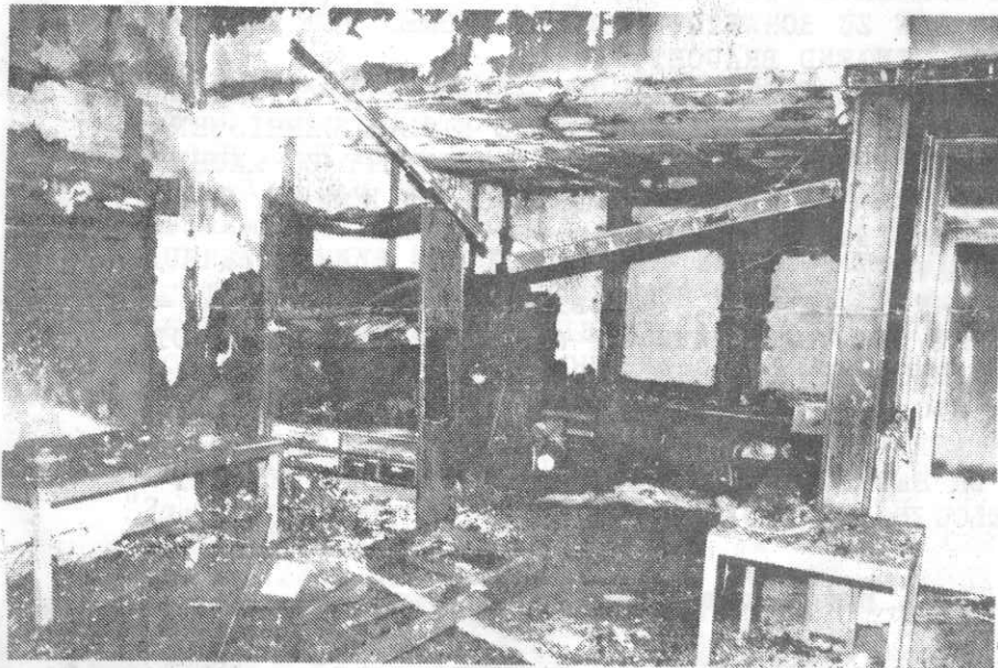
Verkohlte Balken, verschmorte Möbel und zerstörtes Kinderspielzeug: So sah der Gruppenraum der Hortkinder nach dem Brand aus.