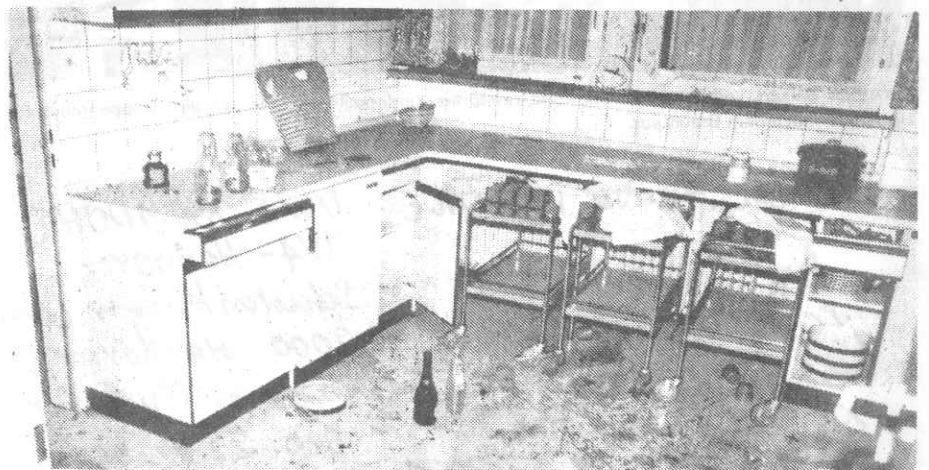
In der Küche rissen die Unbekannten Lebensmittel und Geschirr aus den Schränken und verschmierten das Essen auf den Fußboden.

ER BELÜGT SICH NICHT UM FREUNDSCHAFT / ER HAT IMMER UNTERSCHIEDEN ZWISCHEN INTERESSE UND GEFÜHLEN/ UND ER HAT DIE WIRKLICHKEIT NICHT HINTERGANGEN/ SIE IST IN IHM UND ER HAT SICH TROTZDEM NICHT VON IHR AUF-FRESSEN LASSEN/ WIDERSTAND ZU LEISTEN HEIßT WEDER PUNK NOCH ALTERNATIVER ZUSEIN/SONDERN ANDERS ZU SEIN/ ES HEIßT NICHT ZU REDEN/ DENN VERÄNDERUNGEN FINDEN NICHT IM KOPF / SONDERN IN DER REALITÄT STATT/ VERÄNDERUNGEN ERSCHÖPFEN SICH NICHT IM ÄUßERLICHEN/ SONDERN WIE MENSCH SICH VERHÄLT/